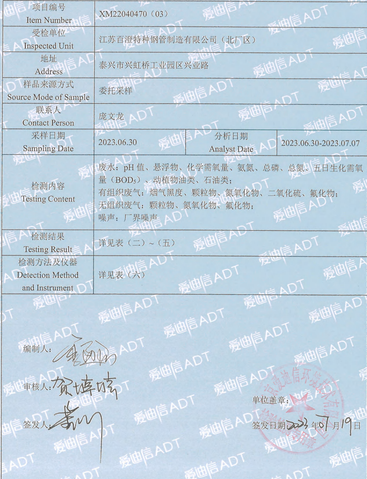
表 (一) 项目概况说明