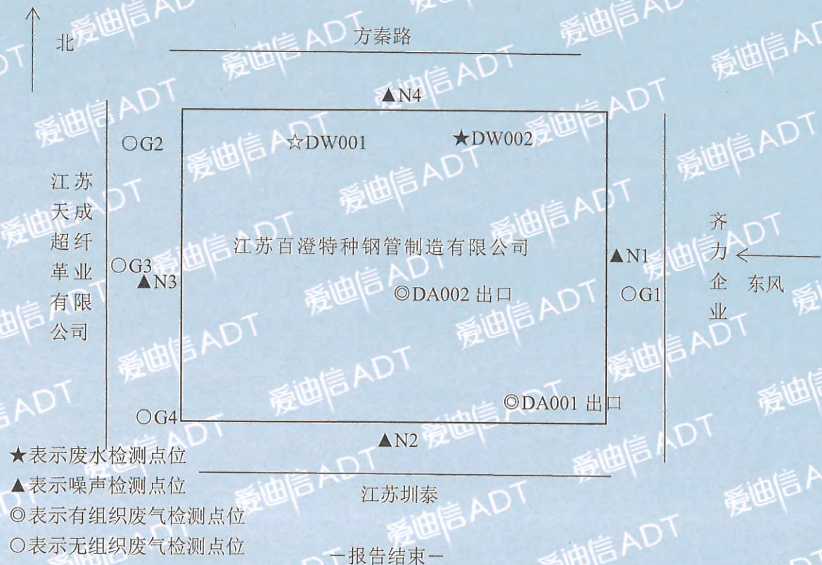
附检测点位图 (2023.03.08) :