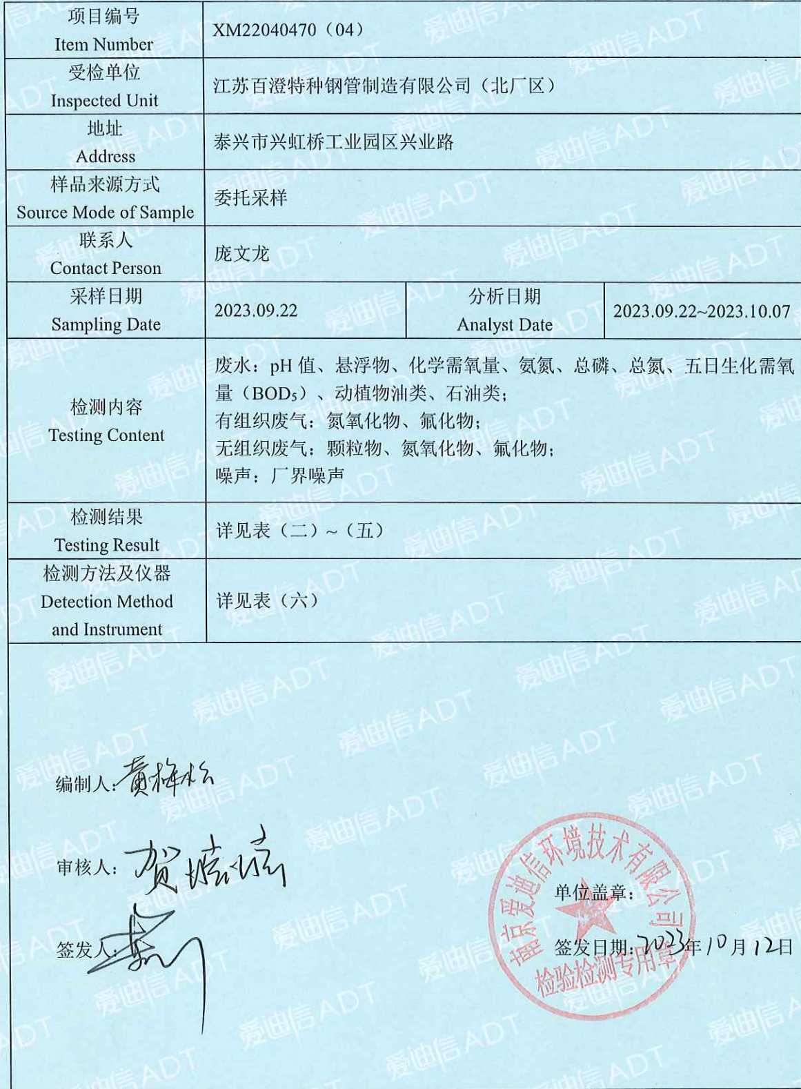
表 (一) 项目概况说明